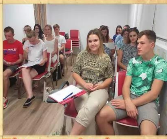
Pozdrowienia od Ekonomistów