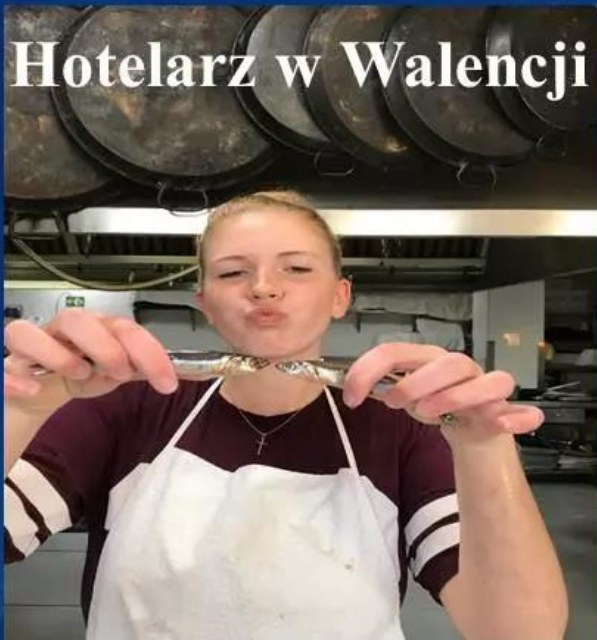
Hotelarz w Walencji